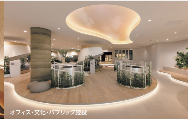
オフィス・文化・パブリック施設