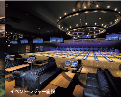
イベント・レジャー施設